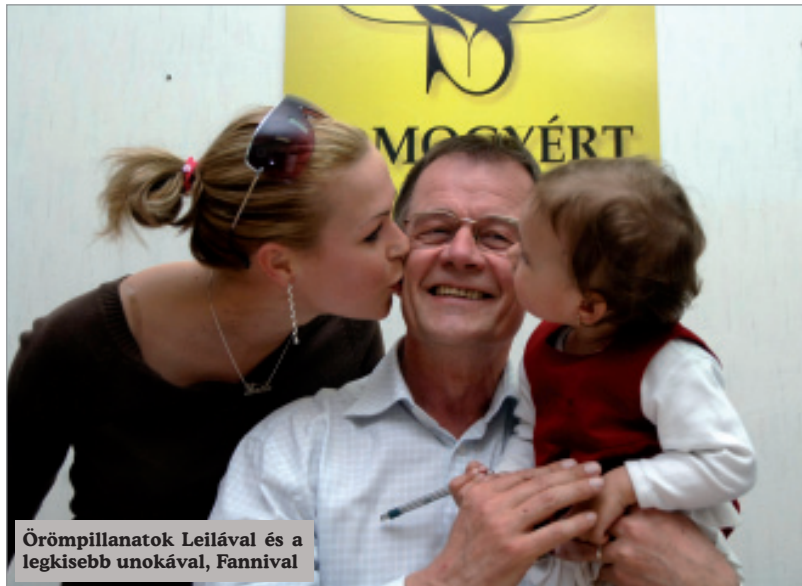
Örömpillanatok Leilával és a legkisebb unokával, Fannival

Gyenesei István, a Somogyért Szövetség képviselőjelöltje nyerte meg a 2006. évi országgyűlési választásokat a somogyi 6-os választókerületben. Az április 23-i második fordulóban már csak két jelölt maradt versenyben, és a Somogyért jelöltje – a legnagyobb arányban nyerve mandátumot a megyében – 57,84 százalékot szerzett., jelentősen megelőzve Kuzma Lászlót, a Fidesz-KDNP jelöltjét (42,16 százalék).